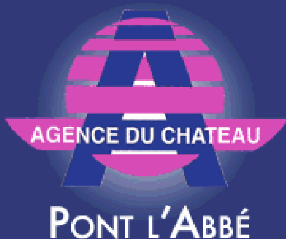
Photo bientôt disponible